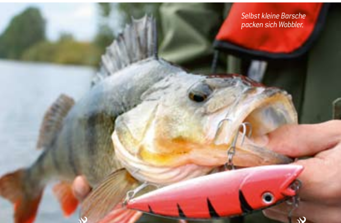
Selbst kleine Barsche packen sich Wobblers.

Genau wie Zander sind Barsche die überwiegende Zeit ihres Lebens Grundfische. Da man sie dicht am Boden jedoch nicht mit Spinnern oder Wobblern gezielt beangeln kann, bzw. einfach zu viele Hänger bekäme, empfiehlt es sich, bodennah eher Gummiköder einzusetzen. Twister oder Shads stehen bei Barschen ganz oben auf der Speisekarte. Wenn sie wie ein verletzter Fisch in Richtung Grund taumeln, ist dies oft der Moment, in dem sich die Barsche auf ihn stürzen. Wir als Angler sollten daher immer die Absinkphasen genau beobachten.